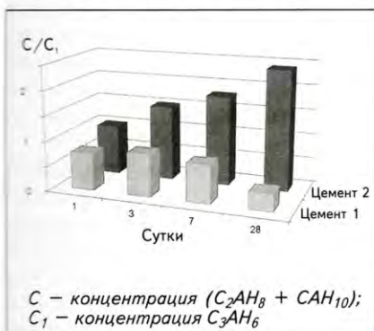
Рис. 2. Соотношение (C_2AH_8 + CAH_{10}) / C_3AH_6 при гидратации цементов 1 и 2 в течение 1–28 сут

C_2ASH_8 в результате реакции ионов Ca^{2+} и Al^{3+} со шлаковым стеклом. Большая часть гидратов представлена в виде CAH_{10} , C_2AH_8 и C_2ASH_8 , вызывающих уплотнение цементного камня. Соответственно прочность при длительном твердении все время повышается. Большое значение в формировании прочной структуры имеет водоцементное отношение. При В/Ц = 0,5 и наличии тех же гидратов имеем более низкую прочность цементного камня.